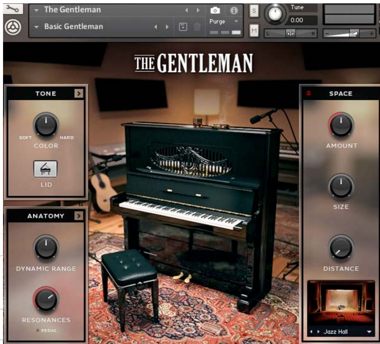
Il pianoforte verticale The Gentleman incluso nella suite Komplete 12 Select

producer in erba avete materiale per sperimentare per molto, molto tempo; nello specifico, il nuovo TRK-01 Bass è un valido tassello per stendere parti ritmiche granitiche . Komplete Start è il supporto ideale anche per il tastierista che voglia estendere il proprio parco di virtual instrument senza stressare troppo un laptop e le unità di memoria esterne collegate; potete anche studiare un investimento per gradi , perché con poche decine di euro potete scegliere nel catalogo NI quei tasselli per voi imprescindibili come timbriche.