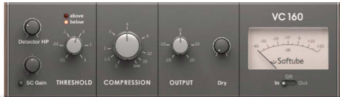
Il plug-in VC-160

La categoria Cinematic include tutta l’offerta studiata da NI a riguardo: oltre a Kinetic Metal troviamo anche la variante Toys, più strumenti quali Thrill, Emotive Strings, Damage, Rise & Hit, la coppia Action Strikes e Strings, infine i tre moduli Evolve, tra cui le varianti Mutations 1 e 2. Passando ai plug-in, per quanto concerne la categoria Studio NI introduce effetti quali Vari Comp , Enhanced e Passive EQ , nonché le tre simulazioni VC 2A , VC 76 e VC 160 . La sezione degli effetti creativi è impreziosita da plug-in quali The Mouth , Molekular , i tre Crush Pack Dirt, Freak e Bite, infine dalle due simulazioni di riverbero RC 24 e RC 48 . Komplete Ultimate è proposto al prezzo di € 1.199: se possedete una versione precedente della suite il prezzo della nuova licenza scende a € 399, mentre i possessori di Komplete Standard o della versione Select possono acquistare l’Ultimate rispettivamente a € 599 e € 999. Non manca in omaggio l’E-Voucher da € 25.