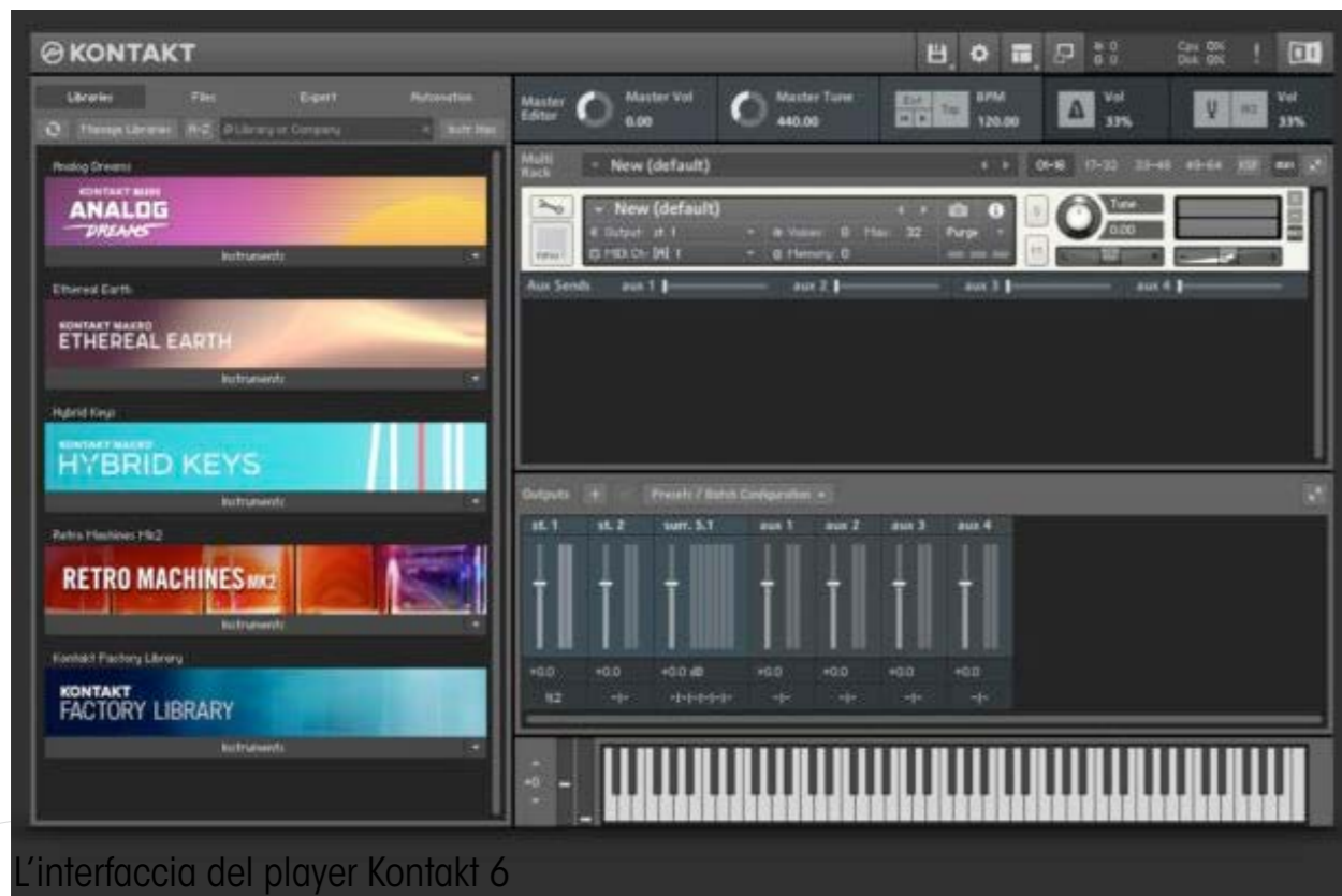
L'interfaccia del player Kontakt 6

lo storico Battery 4 , mentre nelle librerie basate sul campionamento spicca la suite dedicata ai pianoforti acustici, che comprende le due varianti a coda The Maverick e The Grandeur e il verticale The Gentleman . L'offerta dei pianoforti acustici è completata con i pacchetti The Giant e Una Corda , per sonorità più moderne ed evocative. La categoria dei pianoforti elettrici e gli organi è arricchita da pacchetti quali l' A200 e il Clavinet Planet di Scarbee. Per bassi e chitarre Komplete 12 offre le librerie Session Guitarist Strummed Acoustic e la variante MM Bass di Scarbee che va ad affiancare quella dedicata al Rickenbacker. Per la batteria troviamo - oltre a Drumlab - le librerie Studio Drummer e Abbey Road 60s , mentre la serie Discovery dedicata alle percussioni etniche comprende anche i pacchetti India e Middle East .