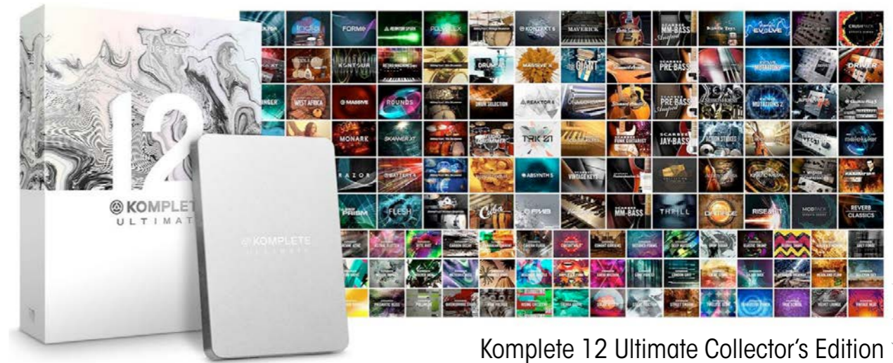
Komplete 12 Ultimate Collector’s Edition

NI ha studiato recentemente questa soluzione esclusiva per chi vuole avere