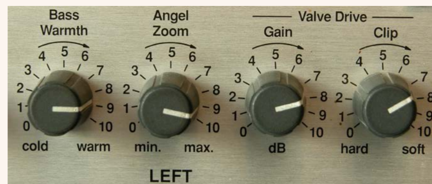
I controlli di equalizzazione e clipper