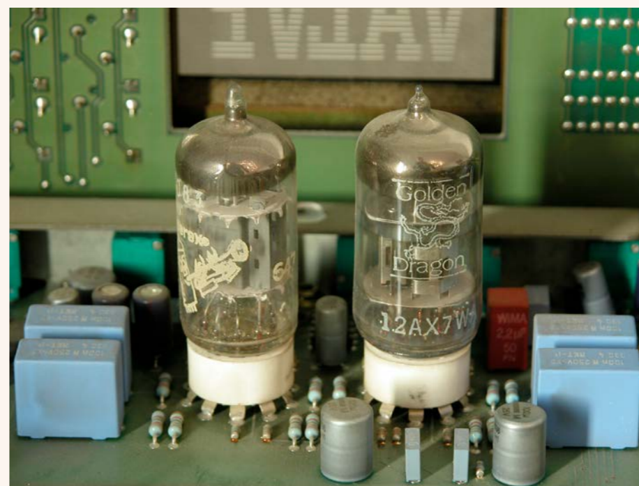
Le due valvole 12AX7

possono trovare posizioni adatte ad aprire il mix o rendere la traccia più facilmente inserita nel mix, soprattutto per i bassi, la cassa e i tom. Non è quindi solo un tool per la distorsione armonica valvolare, ma anche un sistema di controllo della fase. Non è un caso che i D19 MicValve si trovino inseriti in rack per il mastering o fissi nella catena di ripresa per bassi, voce o chitarre distorte. È a tutti gli effetti un processore valvolare di eccellente qualità, con un carattere al momento mai trovato su altri outboard e senza quell'esagerazione valvolare, leggi distorsione immediata, di altri preamplificatori con circuiti valvolari.