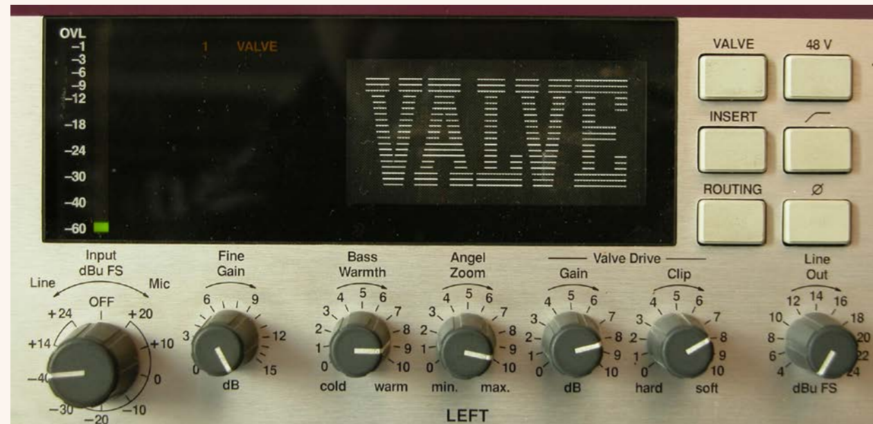
I controlli per ogni singolo canale

lavora tra 10 e 200 Hz, Angel Zoom per enfatizzare le alte frequenze ma anche per aggiungere armoniche alla voce sulle medie, e Valve Drive, che include un potenziometro di Gain e uno di Clip, con possibilità di Hard e Soft Clip. Gli ultimi quattro pulsanti, sulla destra, definiscono la modalità di bit in uscita (20 bit, 16 bit con dithering, 16 bit con noise shaping), il sync interno o esterno con frequenze a 44.1 o 48 kHz, la modalità Peak Hold per il meter PPM, e l'attivazione di un soft clip prima della conversione A/D.