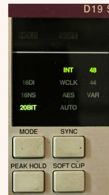
I controlli per il convertitore e il clock

da insert sul master bus. Tutta la costruzione e i componenti sono di primissima qualità e quelli più critici, come i convertitori e alcuni operazionali, sono montati su zoccolo. A distanza di trent'anni, tutto funziona ancora alla perfezione, comprese le quattro valvole.