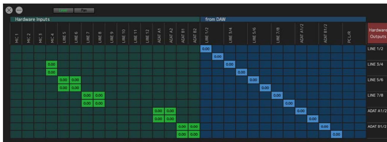
La finestra Matrix Mixer

Per impostare routing più specifici o complessi e per utilizzare le altre funzioni di AXR4 basta aprire l'applicazione dspMixEfx, che è il mixer interno dedicato che permette di usare i plug-in caricati nel DSP interno a latenza prossima allo zero, decidere quali uscite analogiche affidare alle cuffie, impostare le mandate al riverbero interno, il pan, il pad, il volume, l'alimentazione a 48V, l'inversione di polarità e il filtro passa alte e la sua frequenza di taglio, nonché la funzione Silk Texture dei quattro ingressi microfonici/Hi-Z.