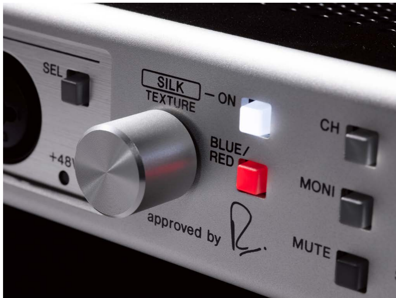
I controlli di Silk

processati dai plug-in, punto debole del digitale. La conversione D/A è invece affidata a quattro AK4495EQ in modalità stereo, sempre a 32 bit e 120 dB di dinamica, puliti e trasparenti. I preamplificatori sono dei THAT 1580 (controllati digitalmente da dei THAT 5171) con ben 53V/ \mu s di slew rate, un valore molto elevato che permette di catturare anche i transienti più incisivi e veloci con una precisione assoluta e una distorsione armonica dello 0,0005% a ben 40 dB di gain. La funzione Silk Texture, attivabile su tutti e quattro gli ingressi microfonici, è firmata Rupert Neve ed emula i circuiti nati per colorare il suono in due modi piuttosto differenti tra di loro: Red per esempio ha un suono ricco nelle altissime frequenze e più scarno sulle basse, mentre Blue ha un carattere più vintage, molto