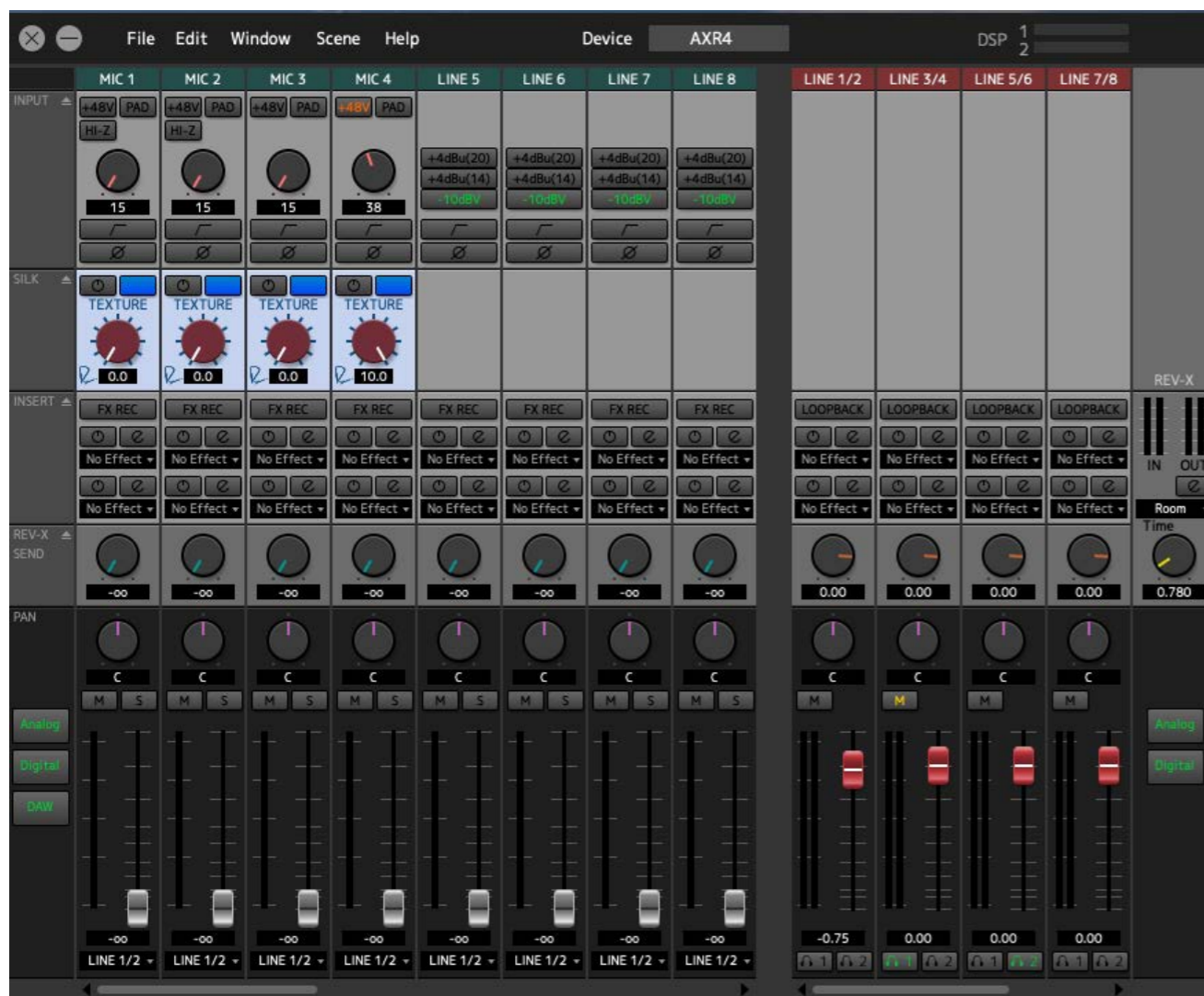
Il mixer interno