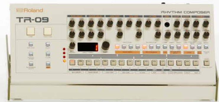
TR-09 RHYTHM COMPOSER