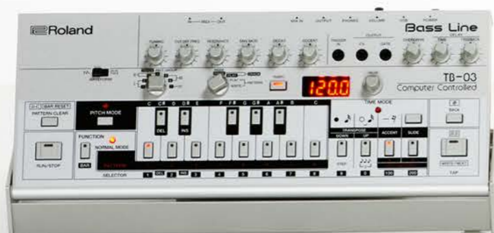
TB-03 BASSLINE SYNTH

LEGENDARY SOUND IN THE PALM OF YOUR HAND