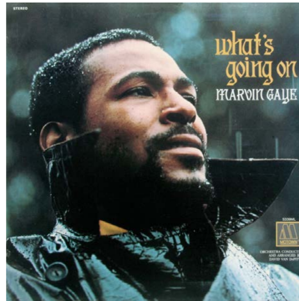
Una copertina passata alla storia, What's Going On di Marvin Gaye

A breve distanza, Ballard è sostituita da Cindy Birdsong con cui il gruppo pubblica il primo singolo della storia sotto il nome di Diana Ross & The Supremes (l'originale sarà ripristinato a seguito dell'uscita dal gruppo della Ross).