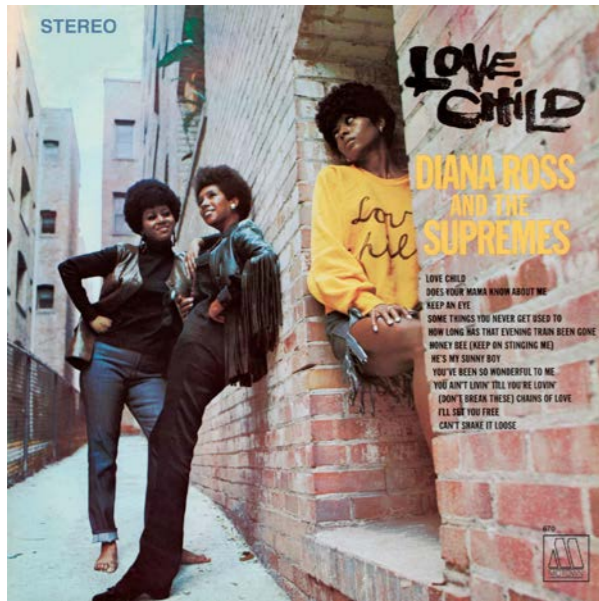
La copertina di Love Child delle Supremes, notare l'approccio grafico completamente diverso rispetto al passato