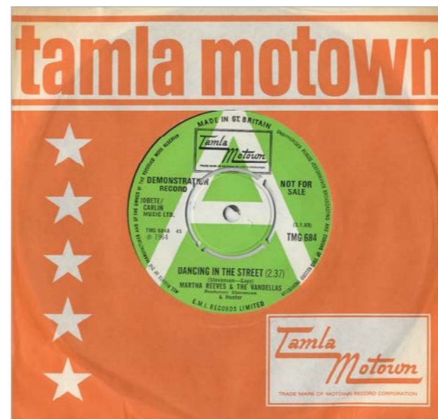
Una copia Demonstrational Record di Dancing In The Street

“Il primo tour dei Jackson 5 partirà da Philadelphia e segnerà l'inizio della Jackson 5-mania. Tutti gli album pubblicati dal gruppo nel 1970 raggiungeranno la Top 5”