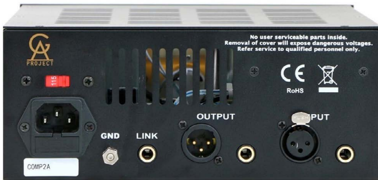
Le connessioni posteriori

nel proprio setup uno strumento ispirato a quello che all'epoca costava una fortuna e oggi forse ancora di più: il famosissimo Teletronix LA-2A, che non ha certo bisogno di ulteriori presentazioni.