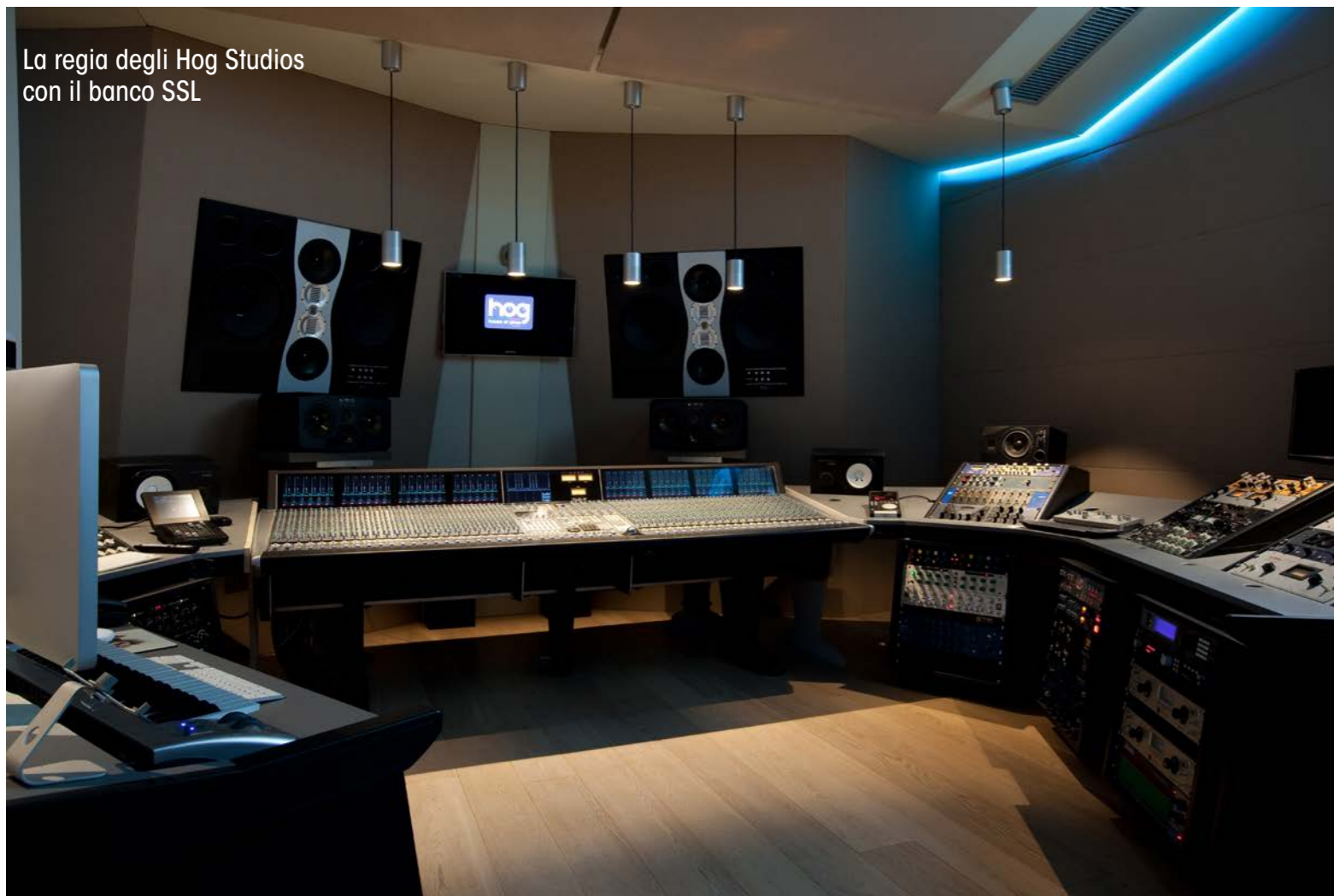
La regia degli Hog Studios con il banco SSL