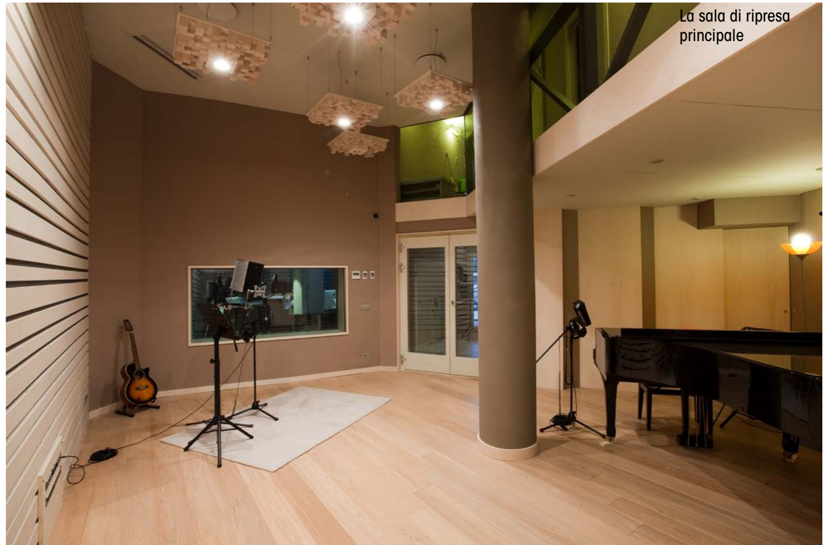
La sala di ripresa principale

GB L'arrivo dell'era digitale mi ha cambiato la vita (e fatto conoscere la Apple) non tanto in termini di qualità che, soprattutto agli inizi era a mio parere in forte appannaggio del mondo analogico, ma soprattutto in termini di workflow. Utilizzavo tre ADAT al posto dei classico 24 piste a nastro: passare all'HD recording con annessa scheda audio da 12 canali della Korg (il modello 12/12) fece crollare in maniera drastica i tempi di produzione, il tutto a vantaggio della