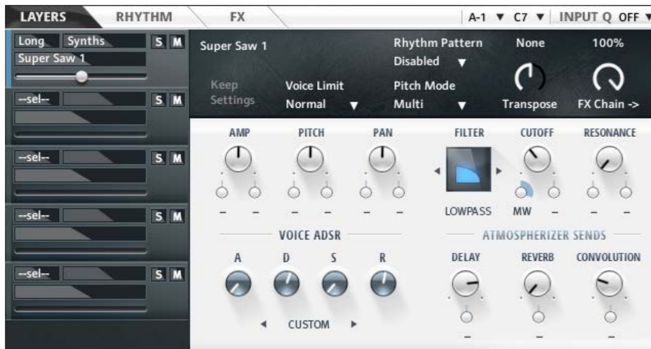
Finestra principale di Aurora

ritmiche con percussioni e polystep pattern, aggiungendo successivamente soundscape, synth, plucked sound e strumenti acustici che sono la base principale da cui partire; la struttura a cartelle degli instrument della libreria di Aurora è infatti suddivisa in Electronica, Featured, Fx, Impacts, Key&bell, Sequenced&arpeggiated, Sustained. In termini sonori, Aurora è davvero particolare, può trovare ampio spazio integrando altre librerie con personalità più spiccatamente elettronica.