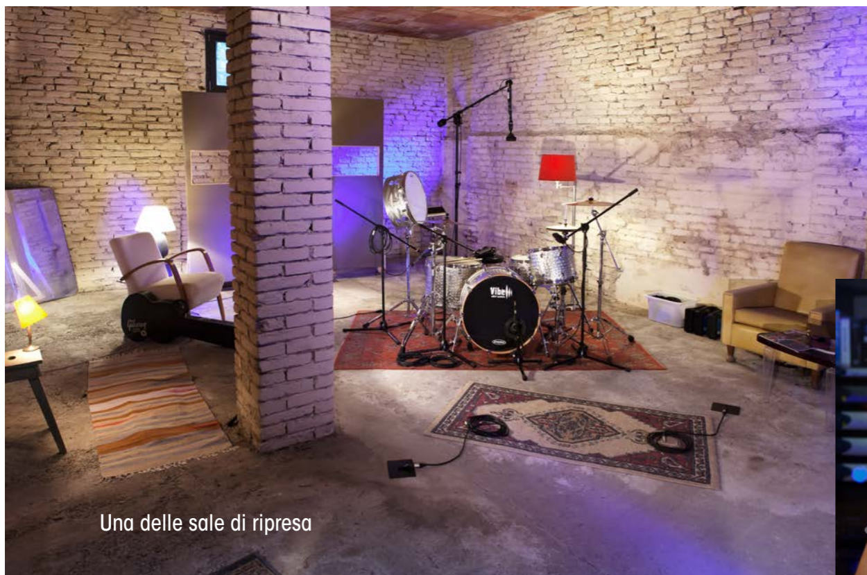
Una delle sale di ripresa